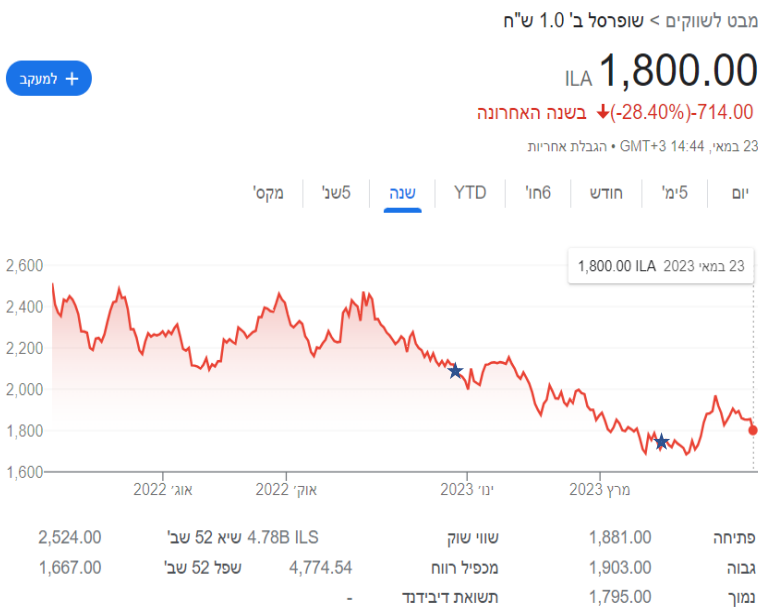
סימול: המלצה קודמת

מקור השם שופרסל היה במקור, הלחם (חיבור) של צמד המילים "שופרא" משמע "איכותי, מובחר" ו"סל". עם הזמן הבינו שהציבור אינו הוגה את השם באופן שאליו התכוונו והחליטו לאמץ את הצורה השגורה והשם "שופרסל" תפס תאוצה בתקשורת.