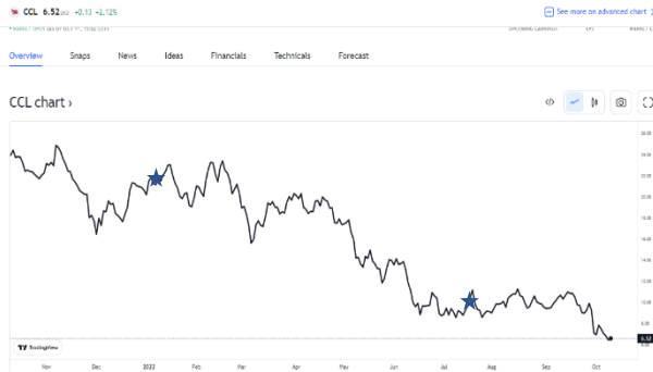
המקור: TradingView סימול: המלצה שבועית

התאגיד קרניבל הוקם בשנת 1972 בשם "קרניבל קווי נופש" (Carnival Cruise Lines) על ידי תד אריסון. בשנת 1987 הנפיקה לראשונה 20% ממניותיה לציבור. בעזרת ההון שגייס מהציבור החל אריסון בהרחבת פעילות החברה באמצעות רכישה ומיזוג של חברות אחרות מהתחום.