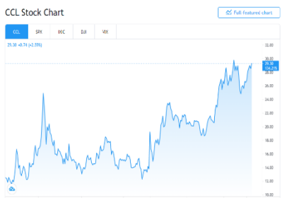
סימול: המלצה קודמת